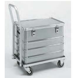
Ausführung mit Griffbügel und Transportkiste