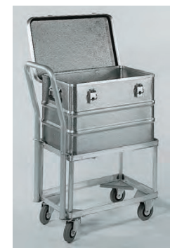
Ausführung mit Griffbügel und Transportkiste