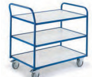
Tischwagen mit 3 Etagen