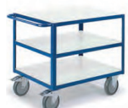
Tischwagen mit 3 Ladeflächen