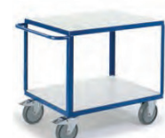
Tischwagen mit 2 Ladeflächen