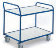
Tischwagen mit 2 Etagen