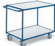
Tischwagen mit 2 Etagen