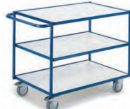
Tischwagen mit 3 Etagen