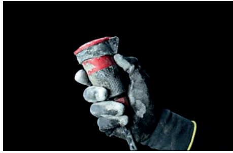
14. STAUBGESCHÜTZT Absolut dicht nach IP 54