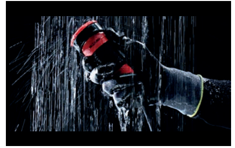
15. SPRITZWASSERGESCHÜTZT Absolut dicht nach IP 54