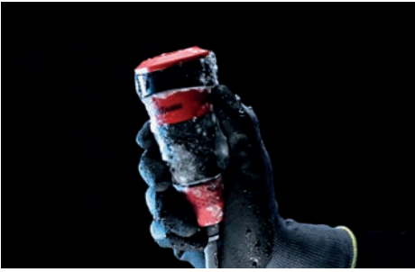
13. KÄLTEBESTÄNDIG Bis -40 °C