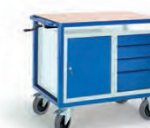
Höhenverstellbarer Tischwagen m. Stahl- Schubladenschrank

Schubladeneinteilungsset für 4 Schubladen mit 2 Längs- und 6 Quertrennblechen pro Schublade, 60 mm hoch Art.-Nr.: 07-4309 Preis: 92,- €