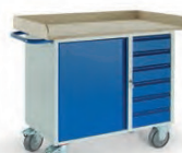
Werkstattwagen 6 Schubladen 1 Stahlschrank Holzrand