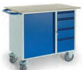
Werkstattwagen 4 Schubladen 1 Stahlschrank