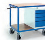
Höhenverstellbarer Tischwagen m. Schubladenschrank