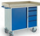
Werkstattwagen 4 Schubladen 1 Stahlschrank Holzrand