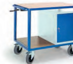
Höhenverstellbarer Tischwagen m. Stahlschrank