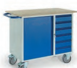
Werkstattwagen 6 Schubladen 1 Stahlschrank